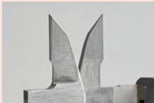
Keményfém betétes mérőfelület